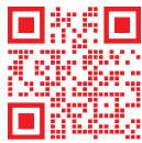
長龍會議顧問 全台徵求場所查詢