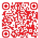
全通事務處理 全台徵求場所查詢

註：以上資料係屬彙總資料，股東如須查詢詳細資料請上證基會網站（ https://free.sfi.org.tw/ ）查詢。